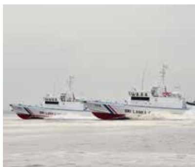
パトロールボート